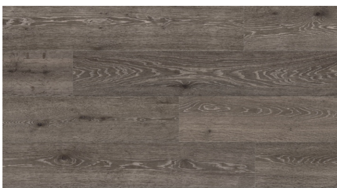
CXL 008 Dub Taunton tmavý