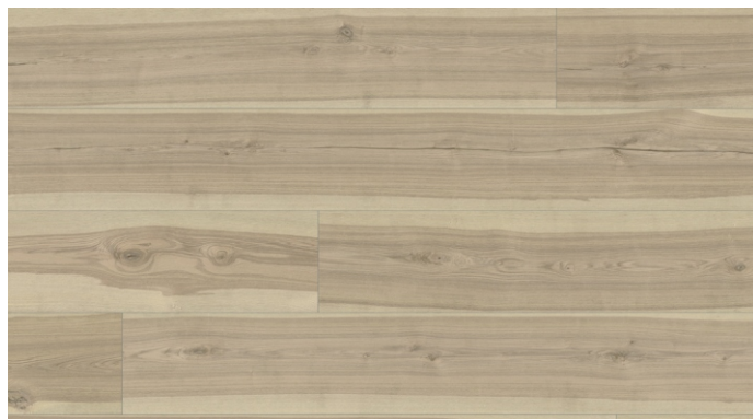
CXL 018 Jasan Tegern