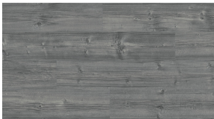
CXL 016 Dub Huntsville šedý