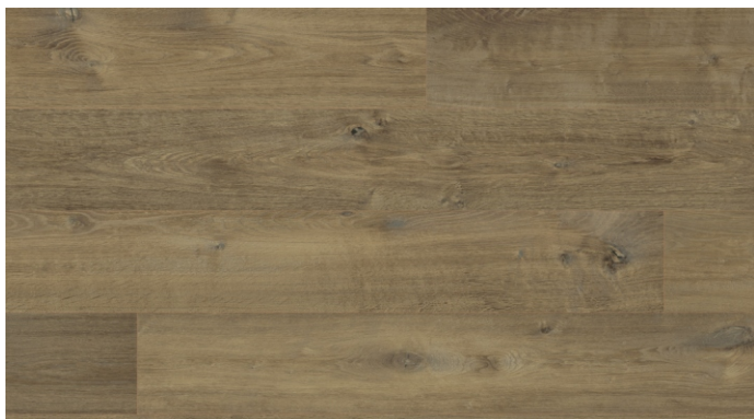
CXL 009 Dub Bennett přírodní