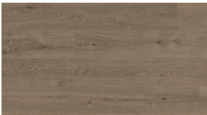
CXL 005 Dub Clermont šedý