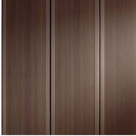
BRAVA MAXI 24 Přírodní