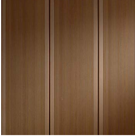
BRAVA MAXI 14 Písková