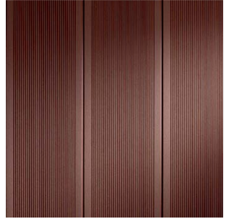
BRAVA MAXI 34 Cihlová