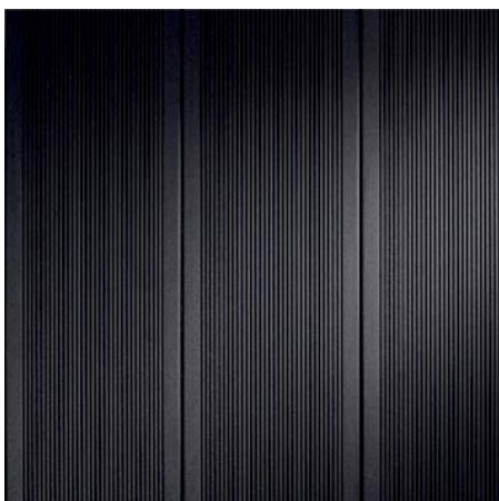
BRAVA MAXI 74 Grafitová