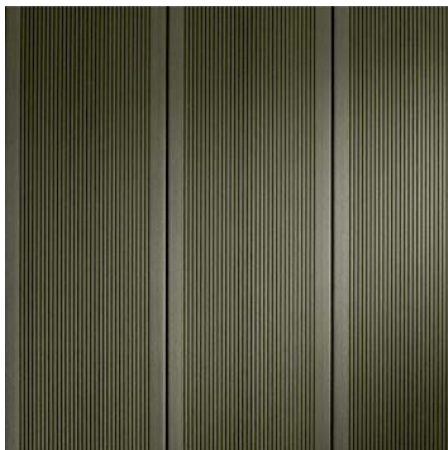
BRAVA MAXI 54 Patina