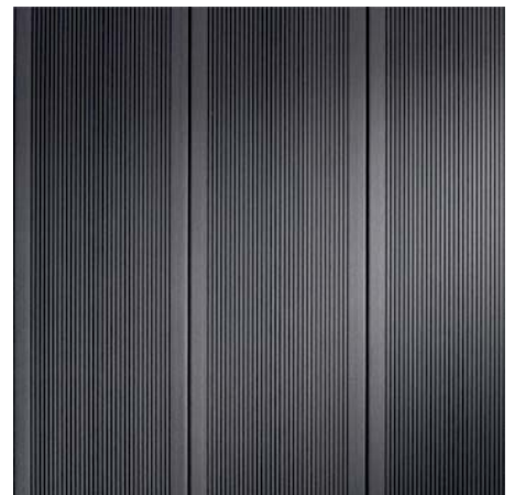
BRAVA MAXI 64 Ocelová